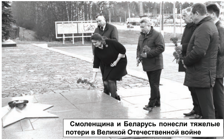
Смоленщина и Беларусь понесли тяжелые потери в Великой Отечественной войне