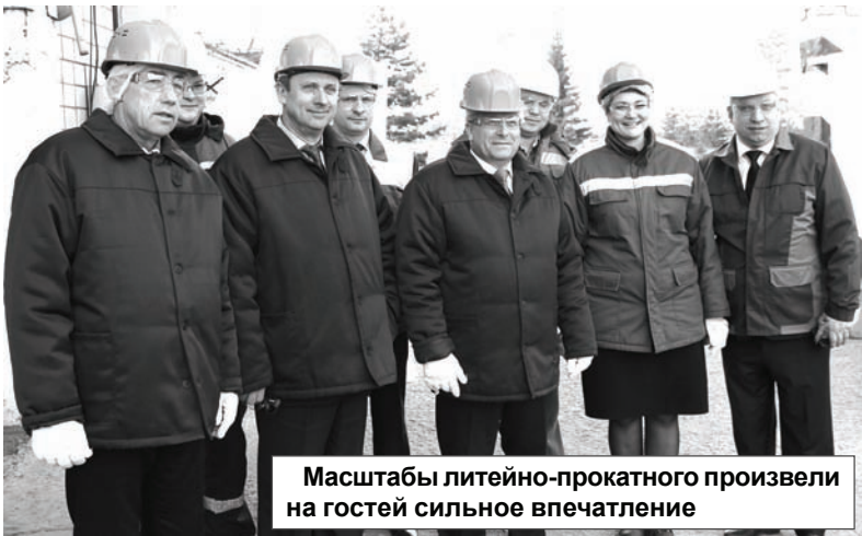
Масштабы литейно-прокатного производства на гостей сильное впечатление

завершился подписанием договора о сотрудничестве