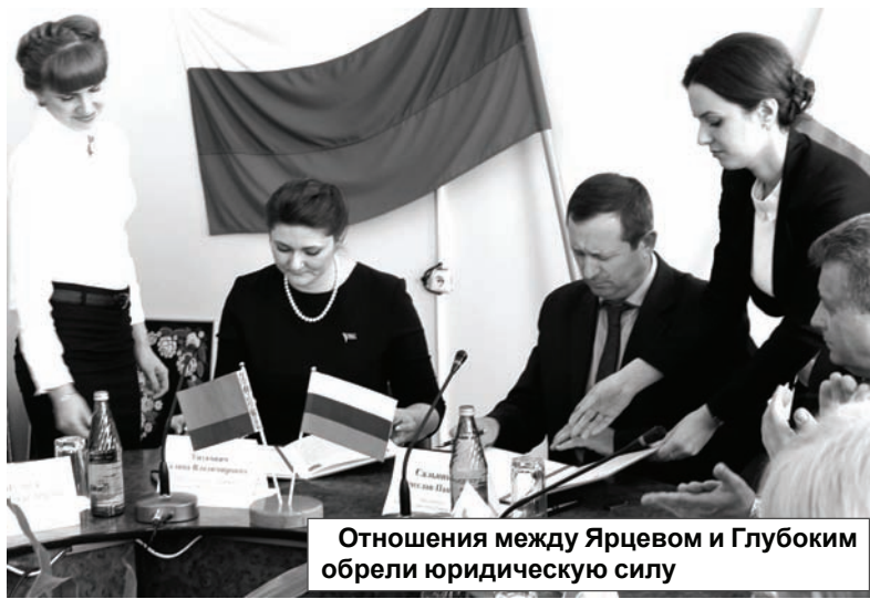
Отношения между Ярцевом и Глубоким обрели юридическую силу