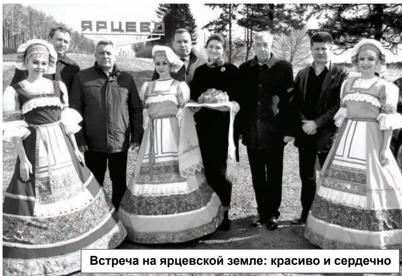
Встреча на ярцевской земле: красиво и сердечно

- В наших культурах есть много общего, нас объединяет единая героическая история, духовность. А сейчас появилось стремление к развитию и продвижению вперед. Надеюсь, что связи между нашими районами теперь будут только крепнуть, а возникшее сотрудничество станет плодотворно развиваться во благо жителей Ярцева и Глубокского.